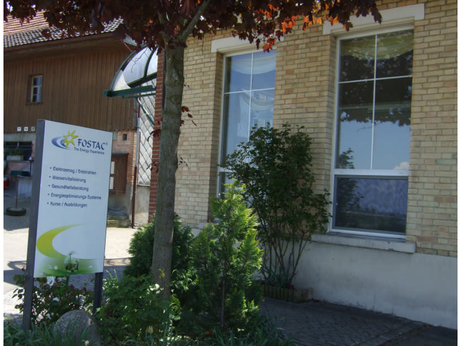
Sitz des Schulungscenters der Fostac AG in Bichwil SG.