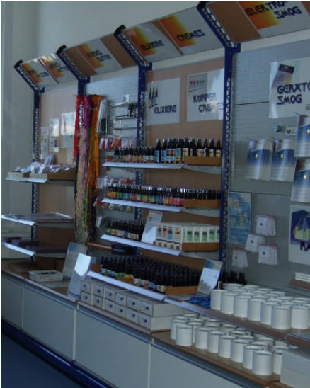
Blick in die Verkaufsräume der Firma Fostac in Bichwil SG.