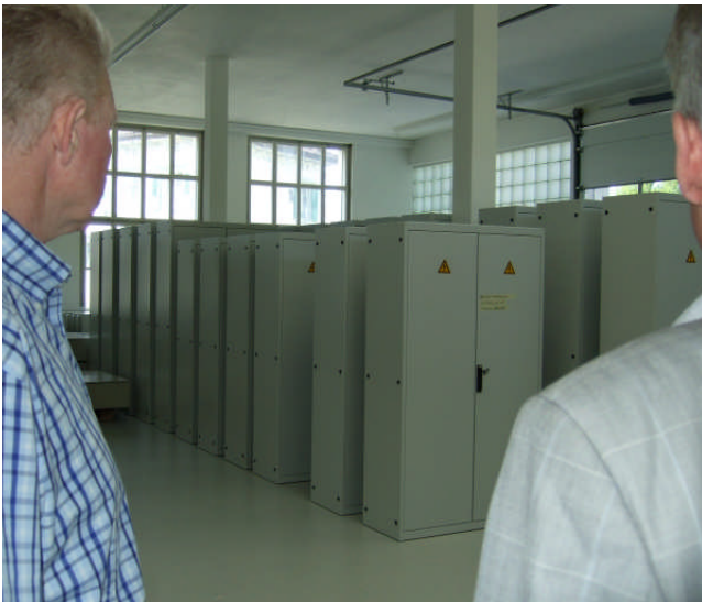
Blick in die Lagerhalle: alle Geräte sind bereits verkauft. Ein deutscher Grossverteiler rüstet einen Teil seiner Supermärkte damit aus!

As: Ich meine nicht die Zertifizierung, sondern die Anschlussnorm.