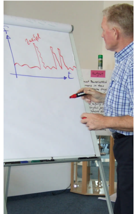
Der Zweifel als negativer Frequenzimpuls kann die Funktion des Geräts gefährden.

Is: Findet denn eine Wechselwirkung zwischen Funktion und Bewusstsein statt?