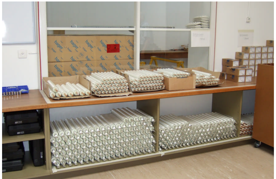
Lager der vorproduzierten, mit Glasfasermatten umwickelten Kupferstäbe, die in die Verteilerschränke eingebaut werden.

HS: Bisher ja, sie werden hier produziert, aber bei uns liegt das Produktionslimit jährlich bei 2'500 Geräten. Wir sind bereits sogenannte strategische Partnerschaften eingegangen und vergeben Lizenzen. Das Programmieren der Geräte kann ich nicht auswärts geben. Man muss beachten, dass wir uns im elektromagnetischen Feld der Erde befinden, und da sich das Elektron im Magnetismus spiegelt, ist die ganze Erde voller Informationen. Wir können keine reine Information auf Silizium geben, solange wir im elektromagnetischen Feld der Erde arbeiten. Ein Teil unserer Technologie besteht daher darin, dass wir im elektromagnetischen Vakuum arbeiten. Dort sind alle Informationen abgeschlossen, und in diesem Vakuum