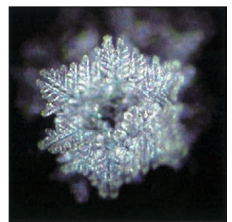
Destilliertes Wasser, welches mit einem Handy mit FOSTAC CHIP über dieselbe Zeit bestrahlt wurde

Auf unserer Homepage www.fostac.ch finden Sie diverse Studien, welche die Wirkungsweise der FOSTAC ® Technologie(*) physikalisch, labortechnisch und energiemedizinisch dokumentieren.